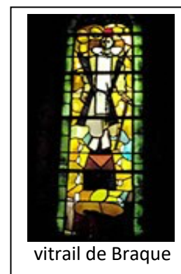
vitrail de Braque

Don possible pour les activités de l'Association des Amis de l'Eglise de Varengueville.